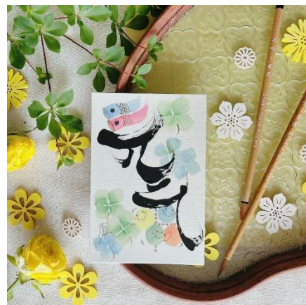
お手本の一例です♪